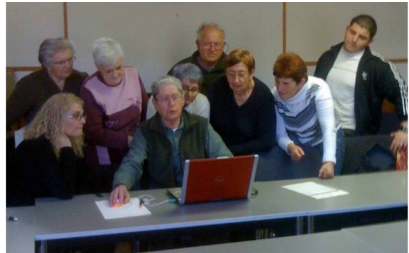
Fête de la musique à Saint Julien

ouvrir les « tiroirs » du savoir, mais surtout démystifier un outil que tous n'appréhendent pas sans quelque crainte. Supposons que nos grands-parents ou nos arrière-grands parents ont ressenti les mêmes réticences à l'intrusion du téléphone ou même de l'électricité. Les sessions vont devoir s'interrompre jusqu'au mois de septembre faute de matériel, mais gageons que, dès la Rentrée, l'ADSL sera mieux accessible à tous et qu'Internet servira tous les foyers de la Communauté des Communes.