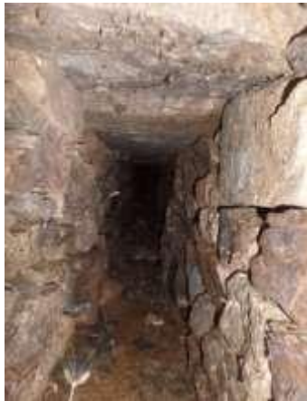
Dernière portion accessible =1m ; l=30cm environ