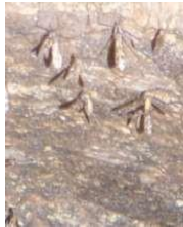
Présence de nombreuses tipules (« cousins »)