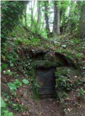
Entrée de la source (h=1m ; l=80cm environ)