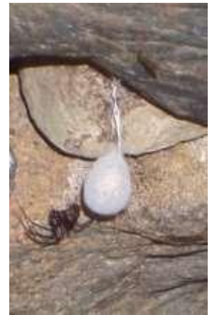
Gardiennage des lieux