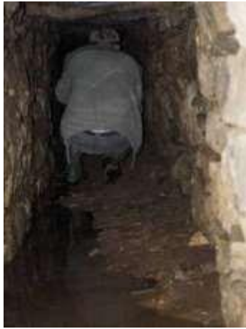
Vers une destination inconnue