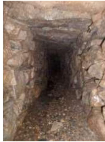
Murs en bon état, constitués de gros blocs de granit empilés sans liant couverts de larges dalles