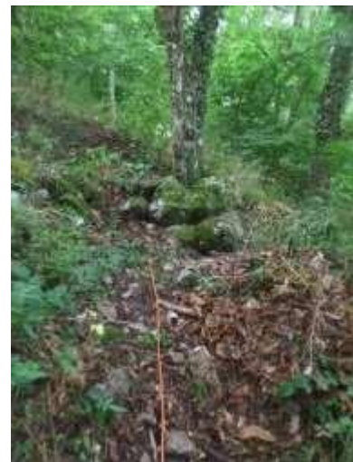
Le fil orange est juste au-dessus du tunnel. Il y a 30m entre l'entrée (au nord) et l'amoncellement de grosses pierres (au sud) avec 3m environ de dénivelé (10% en moyenne) (car au-delà du piquet au fond,, la pente redescend vers un ruisseau)