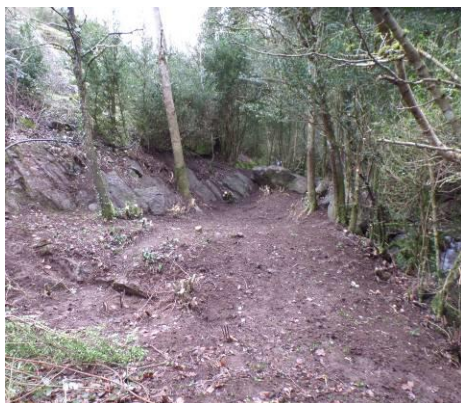
Paroi N/O & reste du mur côté S/O