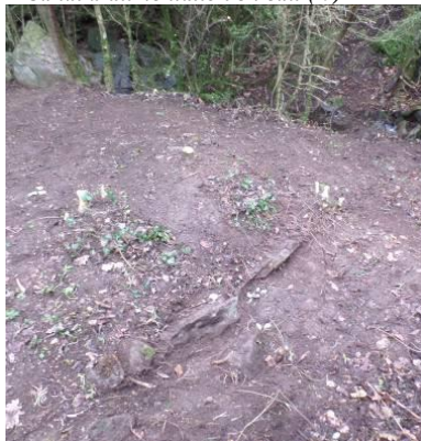
... détail des restes du mur démoli au S/O ...