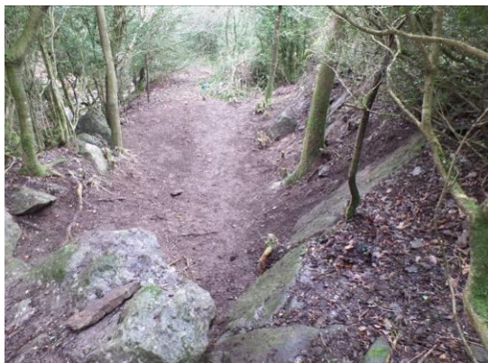
Aspect général (N/E vers S/O)