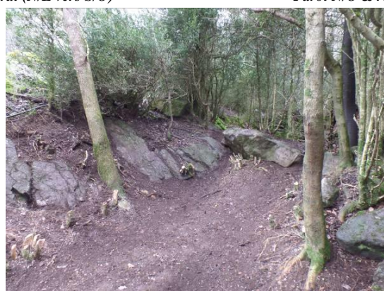
Détail de la paroi N/O