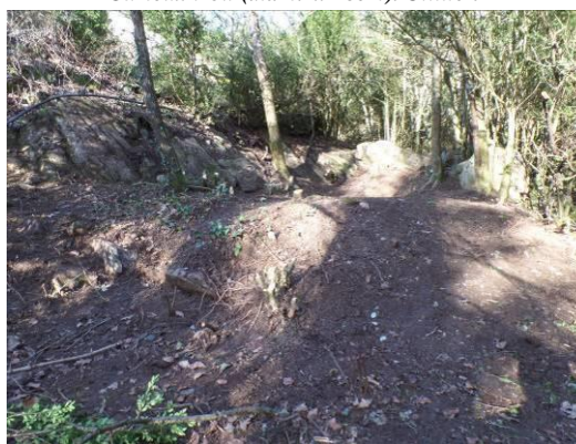
Vue de la citerne depuis le mur démoli au S/O