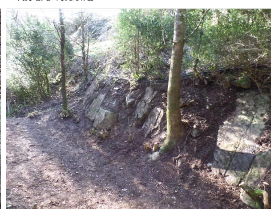
Aspect général de la paroi N/E vers S/O