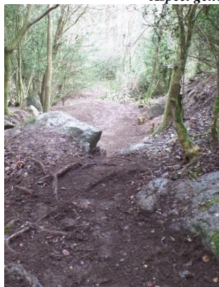
Canal d'alimentation en eau (?)