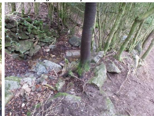
Aspect du « valat » depuis le haut de la citerne