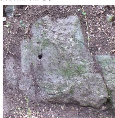
Curieux trou (diam.4x 28cm). Utilité ?