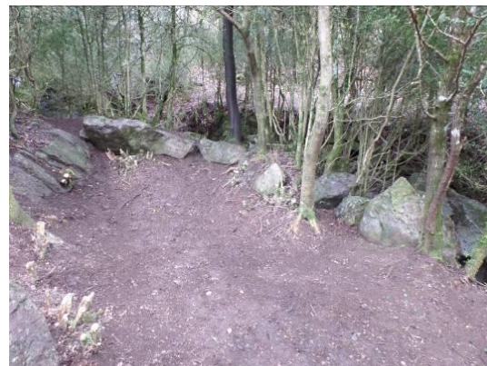
Vue S/O vers N/E